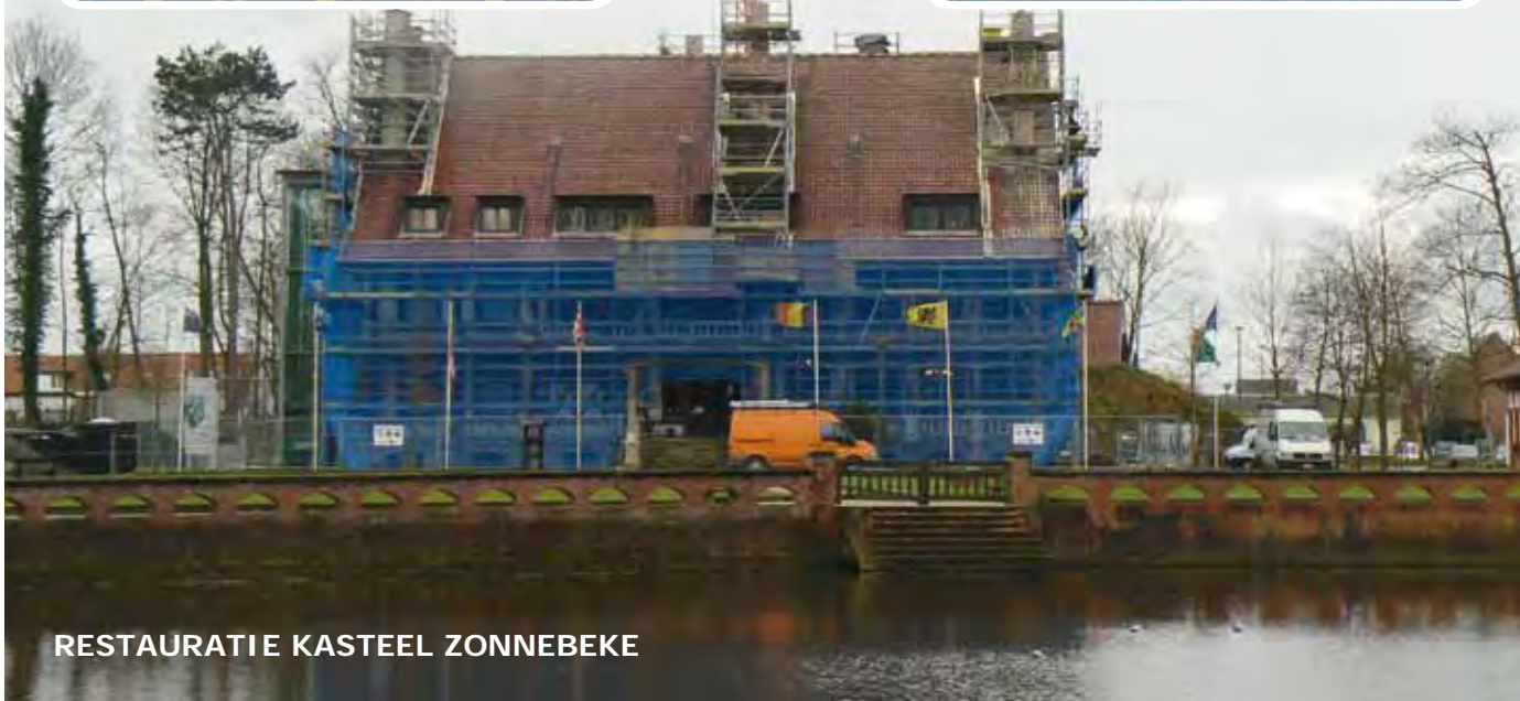
RESTAURATIE KASTEEL ZONNEBEKE