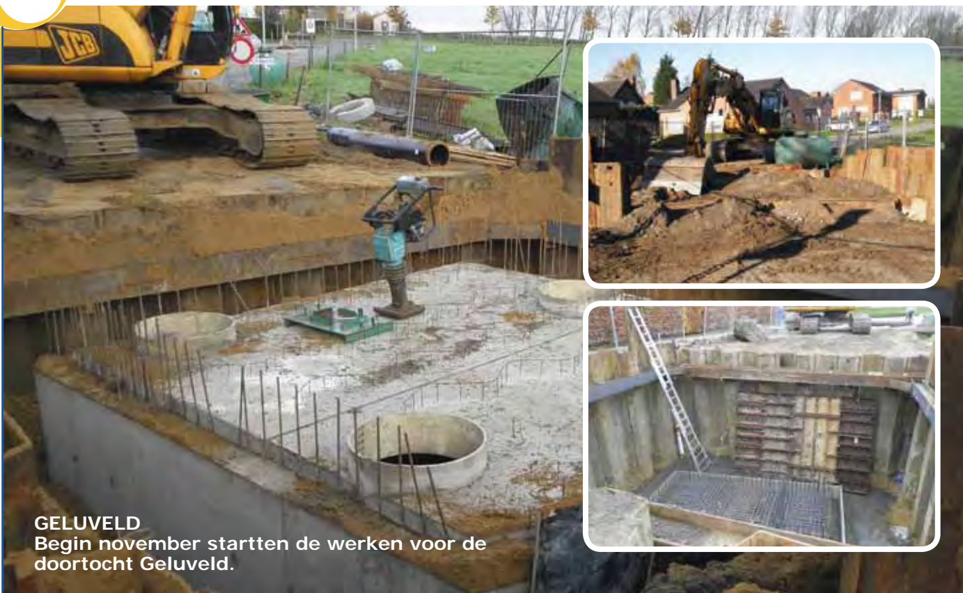
GELUVELD Begin november startten de werken voor de doortocht Geluveld.