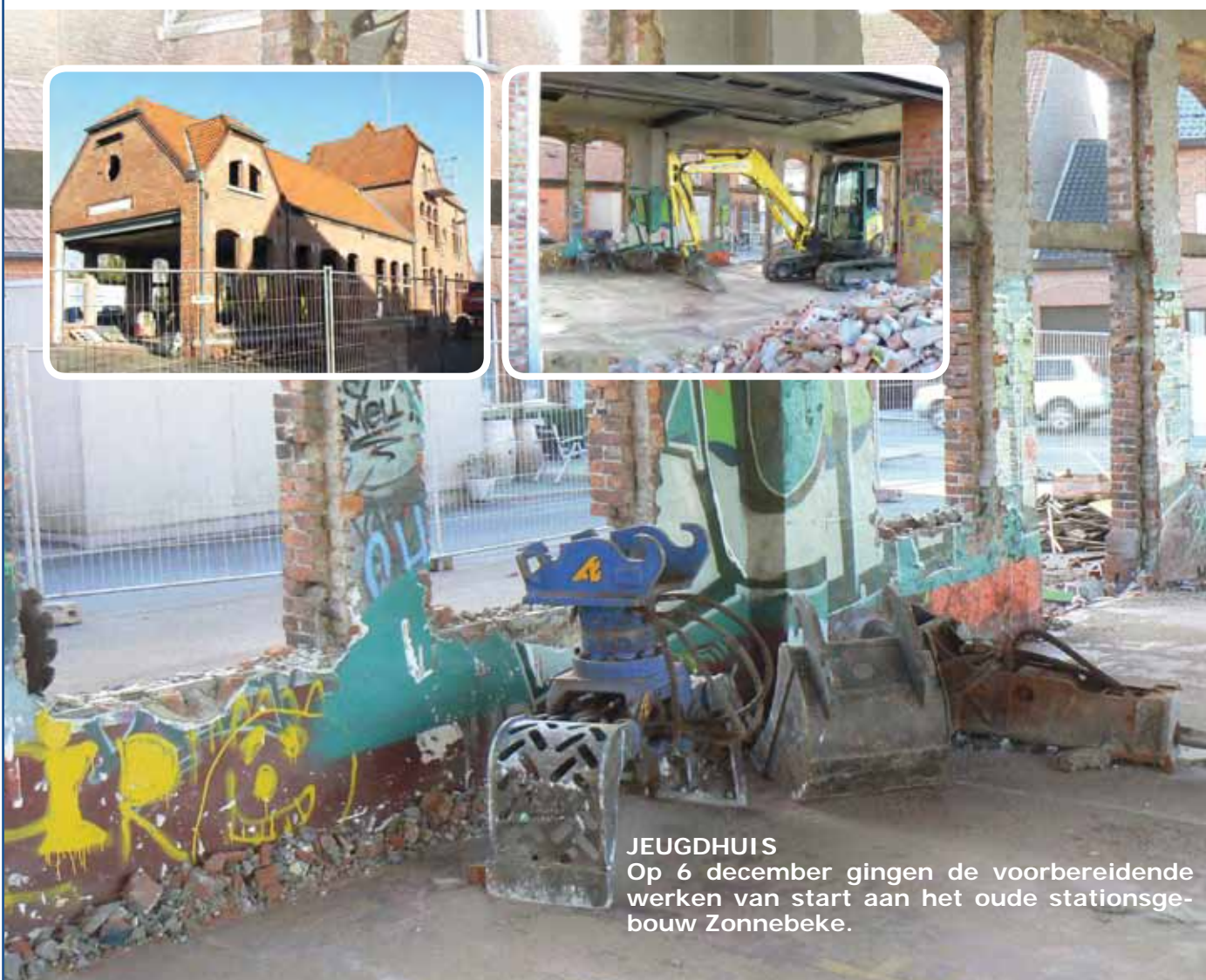
JEUGDHUIS Op 6 december gingen de voorbereidende werken van start aan het oude stationsgebouw Zonnebeke.